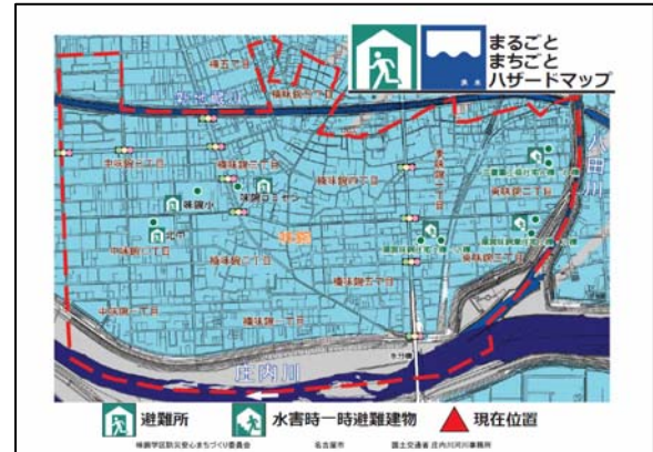
水防災に係る標識イメージ (実寸はA3大)