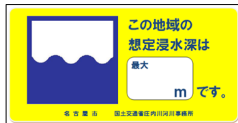
水防災に係るシール (実寸は名刺サイズ)