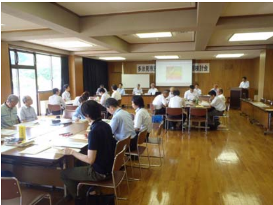
参考資料:第6回 多治見市浸水事前防災行動計画(タイムライン)検討会の様子(H28.6.23 実施)