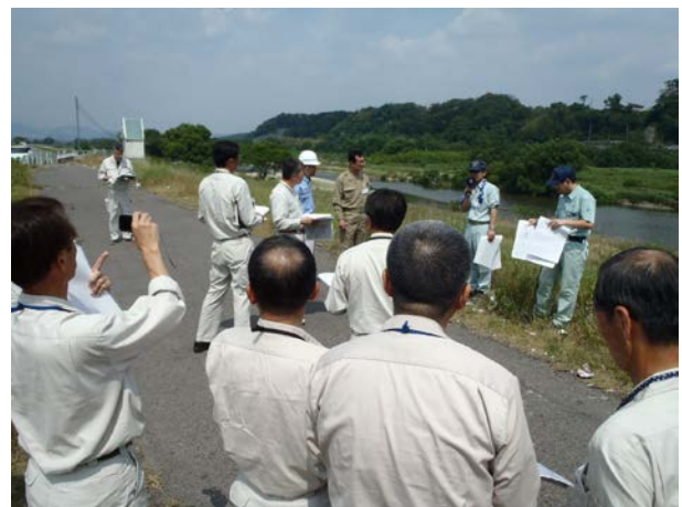
重要水防箇所の点検状況