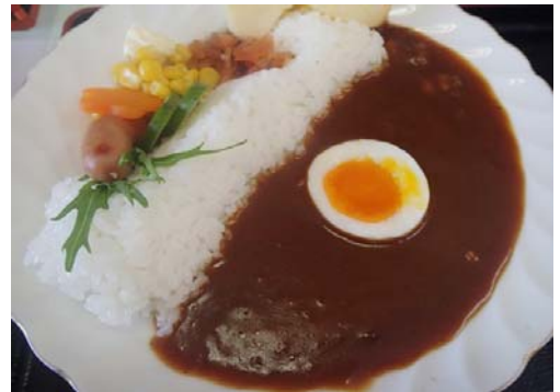
ダムカレー(800円(税込))

申し込み先・ 〒444-2841 問い合わせ先 愛知県豊田市閑羅瀬町東畑67番地 国土交通省 矢作ダム管理所 鈴木 宛 FAX:0565-68-2328 メール: cbr-yahagi@mlit.go.jp TEL:0565-68-2321(電話受付可能) 集合場所・ 新豊田駅に8時15分までにお集まりください 時間