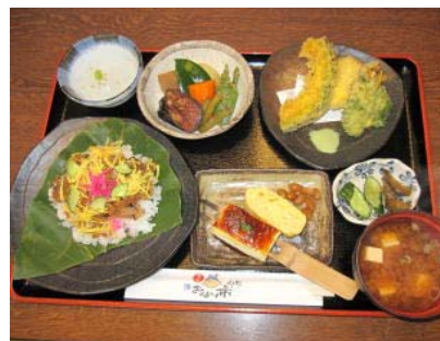
おふくろの味定食（750円〔税込〕）

集合場所・時間 JR可児駅集合の方は、改札口前に8時30分、 新丸山工事事務所（駐車場有り）集合の方は、9時10分にお集まりください。