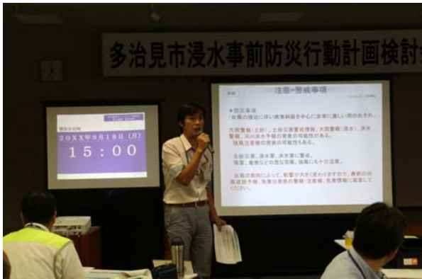
参考資料:第7回 多治見市浸水事前防災行動計画(タイムライン)検討会(机上訓練)の様子 (H28.7.28 実施)