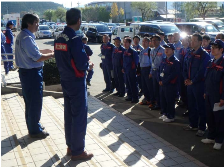
丸森町現地司令部による調査開始のミーティング （丸森町役場）