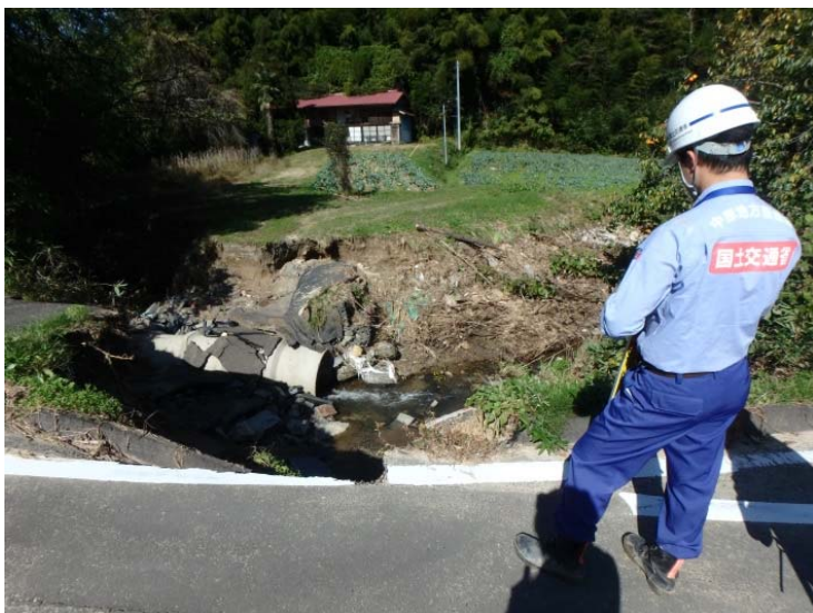
被災箇所調査状況 （柳沢川 25日降雨後の再調査）