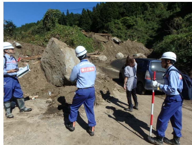
被災箇所調査状況 （沢尻川 25日降雨後の再調査）