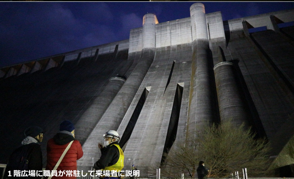
1階広場に職員が常駐して来場者に説明