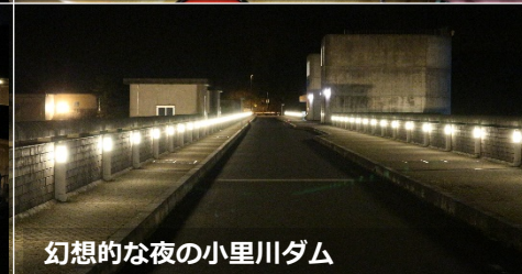
幻想的な夜の小里川ダム