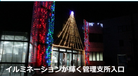
イルミネーションが輝く管理支所入口

12月19日～25日にかけて、小里川ダムで管理用照明器具等を用いたダム堤体のライトアップを実施しました。ライトアップに併せて、管理支所や道の駅「おばあちゃん市・山岡」ではイルミネーションが実施され、23日（金）にはダム堤体の2階展望テラスと1階下流広場からライトアップされたダムを間近で見ることができる夜間特別開放も行われるなど、地元や県外から訪れた多くの方が冬季限定のライトアップイベントを楽しみました。