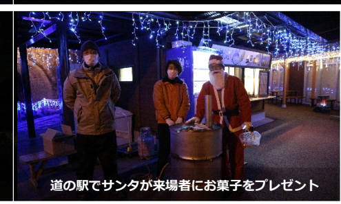
道の駅でサンタが来場者にお菓子をプレゼント