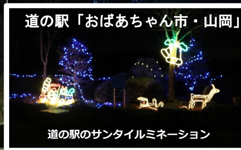
道の駅「おばあちゃん市・山岡」