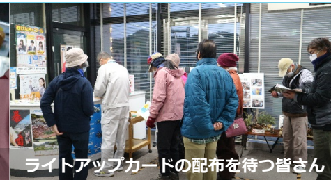
ライトアップカードの配布を待つ皆さん