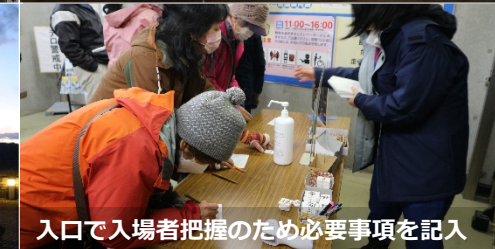
入口で入場者把握のため必要事項を記入