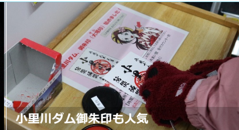
小里川ダム御朱印も人気