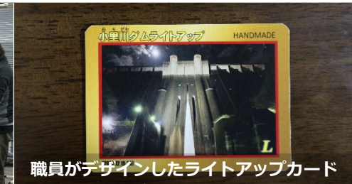
職員がデザインしたライトアップカード