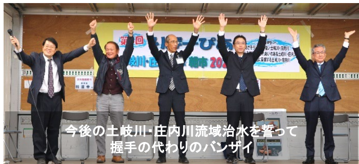
今後の土岐川・庄内川流域治水を誓って 握手の代わりのバンザイ