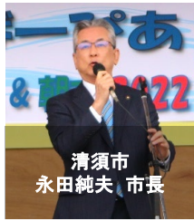
清須市 永田 純夫 市長