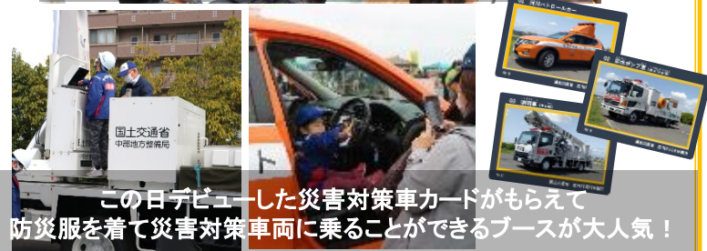
この日デビューした災害対策車カードがもらえて 防災服を着て災害対策車両に乗ることができるブースが大人気！