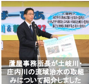
蘆屋事務所長が土岐川・庄内川の流域治水の取組みについて紹介しました