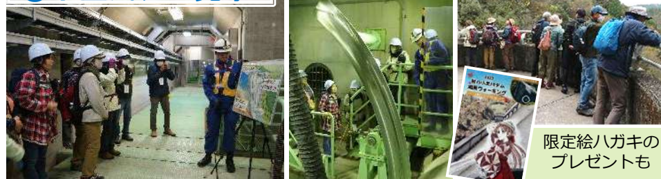
限定絵ハガキの プレゼントも