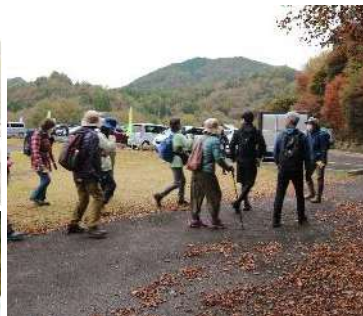
時計回り、半時計回りと 2班に分かれてスタート