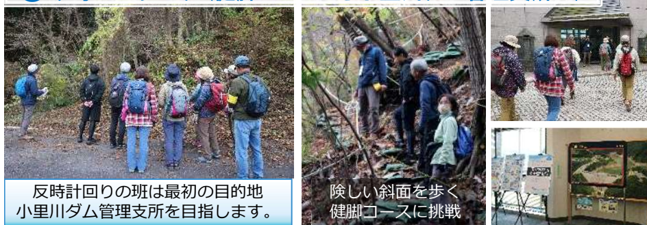
反時計回りの班は最初の目的地 小里川ダム管理支所を目指します。