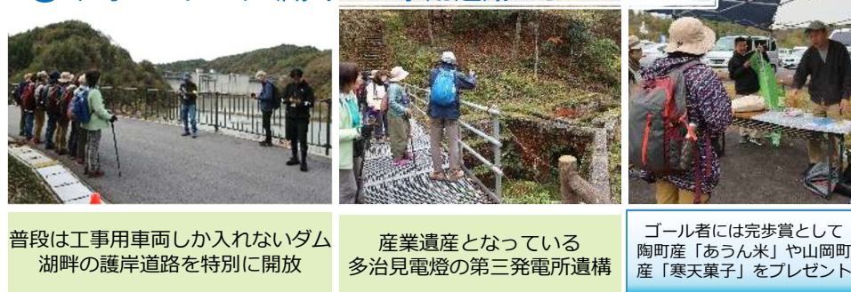
普段は工事用車両しか入れないダム 湖畔の護岸道路を特別に開放