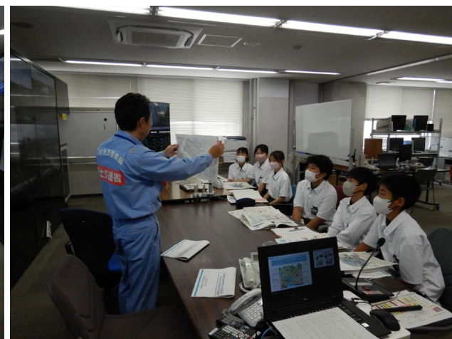
流域治水について理解を深める児童のみなさん