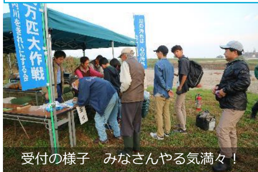
受付の様子 みなさんやる気満々！

11月5日（日）に、庄内川（水分橋～新川中橋）で、庄内川まつり「第49回魚釣り大会」（主催：矢田・庄内川をきれいにする会）が開催されました。この大会は昭和51年から毎年開催され、庄内川が魚のおいしく食べられる川に戻ることを目的に、水質などの環境について考える機会を提供するものです。当日は、暖かな好天に恵まれ、釣り好きの大人から若者、子どもたちなど48名の参加者が自慢の腕を発揮する大会となりました。