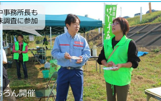
「シジミ汁」の食味調査も もちろん開催