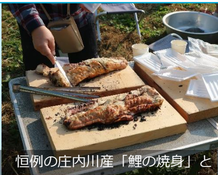
恒例の庄内川産「鯉の焼身」と