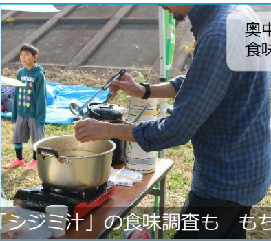
奥中事務所長も食味調査に参加