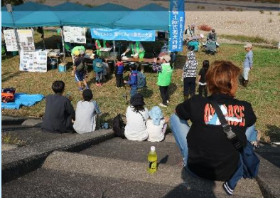
結果発表を待つ皆さん