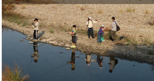
秋の庄内川も素敵な雰囲気です