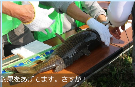
皆さんしっかり釣果をあげてます。さすが！