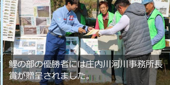
鯉の部の優勝者には庄内川河川事務所長賞が贈呈されました。