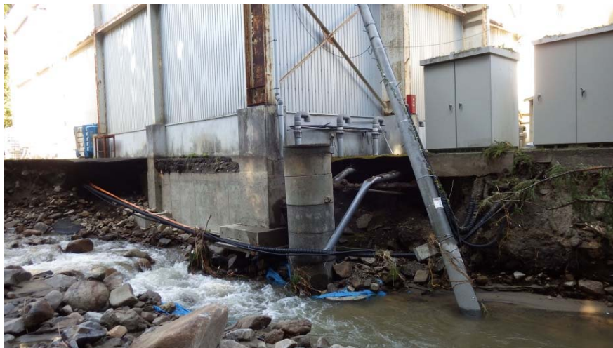
被災状況調査状況(10/16) (岩手県普代村 力持川 三陸水産加工工場)