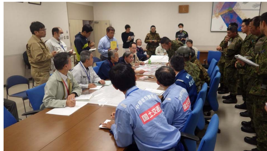
普代村役場の全体打合せ(10/15) (岩手県下閉伊井郡普代村役場)