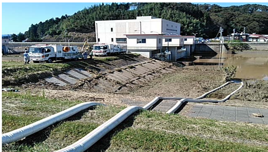
応急対策状況(10/16) (宮城県角田市 阿武隈川 江尻排水機場付近川裏)