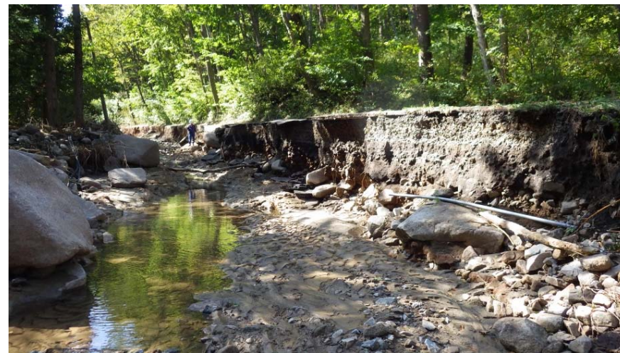
被災状況調査状況(10/16) (岩手県普代村 力持川付近 道路損傷)