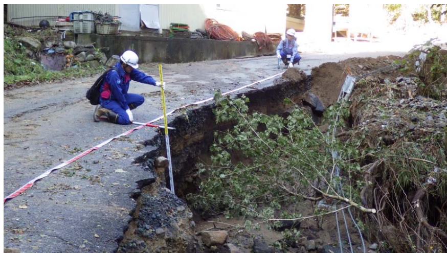
被災状況調査状況(10/16) (岩手県普代村 白井漁港付近 道路損傷)