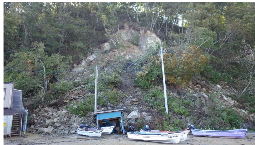
被災状況調査状況(10/16) (岩手県普代村 白井漁港 法面崩落)