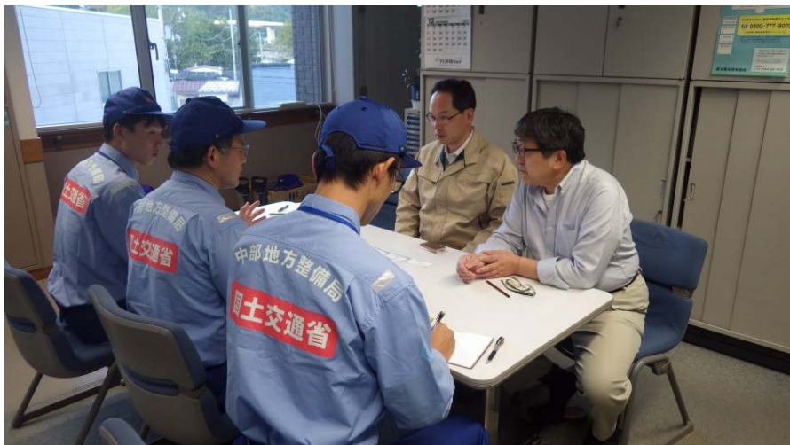
普代村建設水産課との打合せ(10/15) (岩手県下閉伊井郡普代村役場)