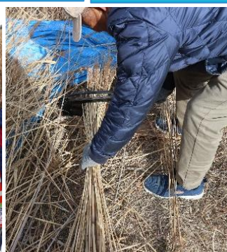
ヨシは不要な帆の部分 をオシギリを使ってカット