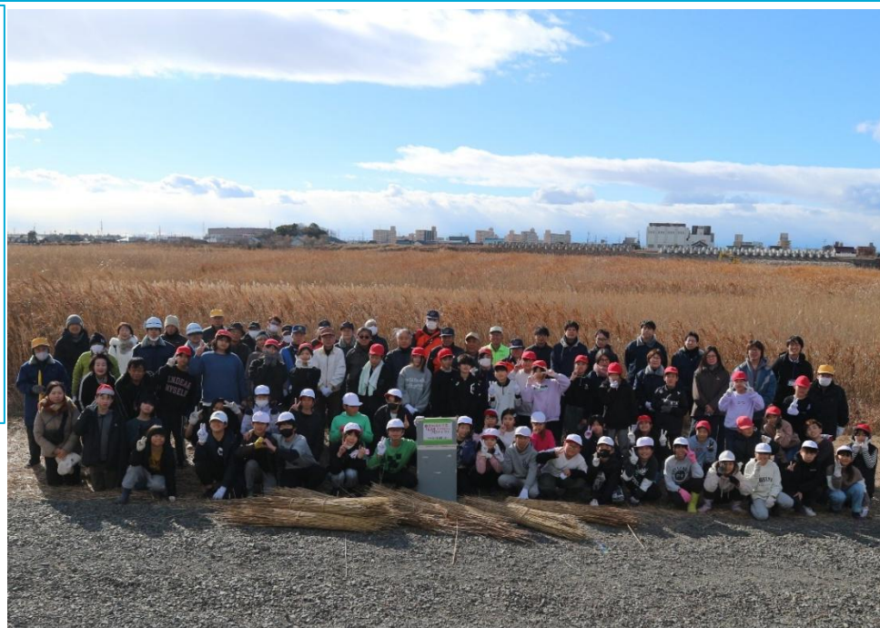
刈り取って選別したヨシを前にみんなで記念撮影