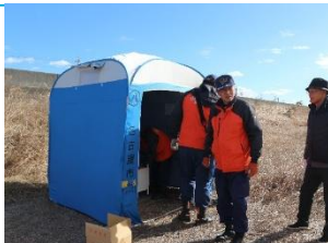
会場を整備し 簡易トイレを設置する 支援者のみなさん