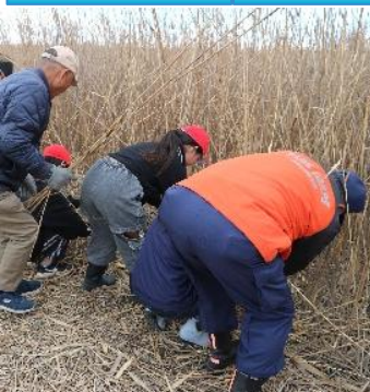
支援者にサポートして もらいながら鎌を使って ヨシ刈りに挑戦！