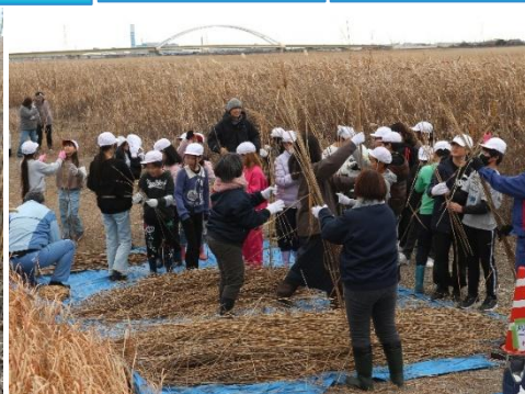
茎の中が空洞なものがヨシ 綿のような物が詰まっていればオギ 刈られたヨシとオギをみんなで分別