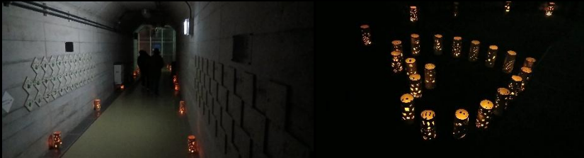
堤体内2Fの通路とテラスの照明を消して瑞浪高校生が製作した灯籠を展示