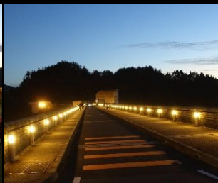
光の列に彩られて幻想的な小里川ダムと、堤体入口へと続くダムの天端