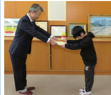
表彰状授与(名古屋市担当課長)