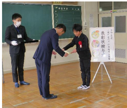
表彰状授与(多治見市長)