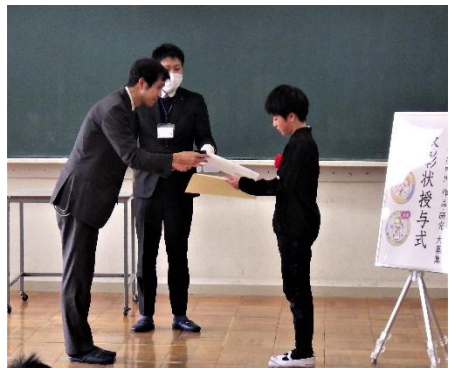
副賞授与(庄内川河川事務所長)