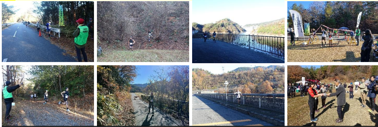
ボランティアの皆さんの協力のもと安全に運営され、無事全員が完走。入賞者にはオリジナルの陶磁器製メダルが授与されました。