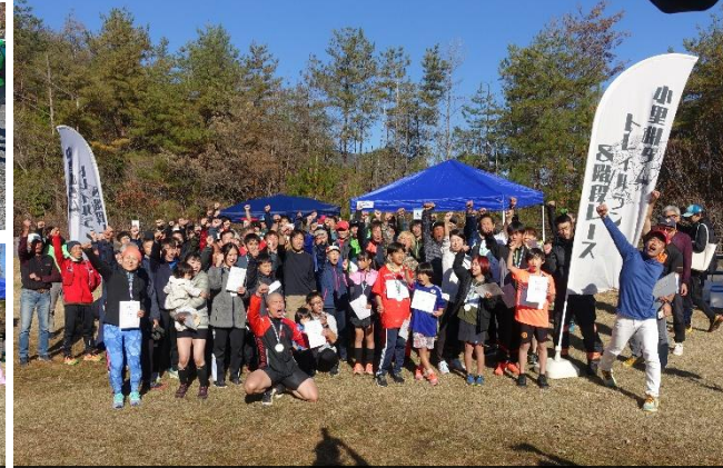
レース後の記念撮影