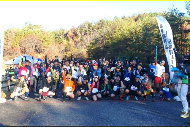
レース前の記念撮影

約6kmの湖周をルートを変えて2周します。自然と構造美が織りなす唯一無二のコースとして、ダムの管理用道路をレースの為に特別開放。中部初のダム湖周トレイルとして開催されました。