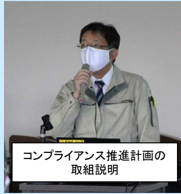
コンプライアンス推進計画の 取組説明

日時：令和2年11月9日(月) 14:00～15:30 場所：みずとびあ庄内 大会議室 参加者：職員 21名 管内の工事・業務受注業者 40名 〔工事 23名〕 〔業務 17名〕 外部講師 1名 計 62名