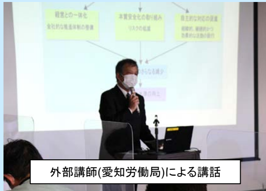
外部講師(愛知労働局)による講話