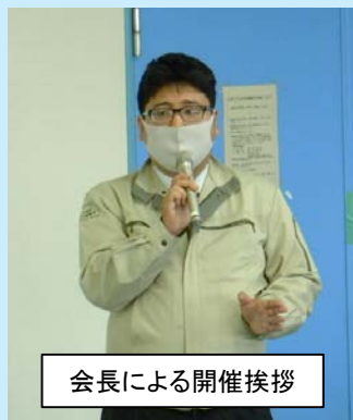
会長による開催挨拶

外部講師による講話や受注業者による安全対策事例報告等を行い安全に対する意識向上を図りました。