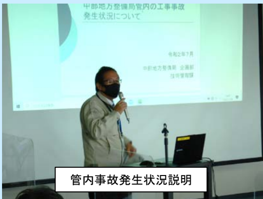
管内事故発生状況説明

日時：令和2年11月9日(月) 14:00～15:30 場所：みずとびあ庄内 大会議室 参加者：職員 21名 管内の工事・業務受注業者 40名 〔工事 23名〕 〔業務 17名〕 外部講師 1名 計 62名