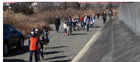
学校から歩いてヨシ刈り会場にやってきた児童たち