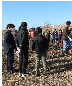
多くの支援者たちに見 守られながらの作業