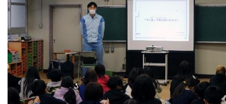
大日本印刷株式会社（DNP）のスタッフが ヨシの特徴や卒業証書ができるまでを説明