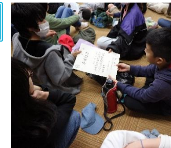
ヨシが使われた卒業証書に 触れて感触を確認しました