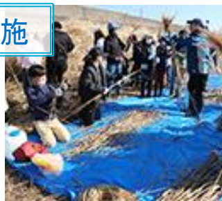
刈られたヨシとオギを分別