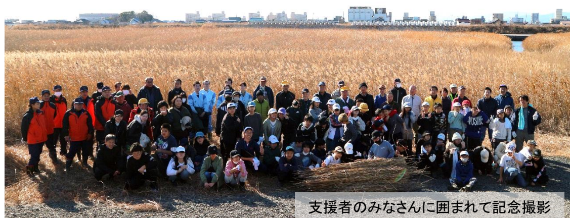
支援者のみなさんに囲まれて記念撮影

ヨシ刈り終了後には学校に戻り、「ヨシの学習会」を実施。ヨシを使った卒業証書ができるまでの話などについて、わかりやすく説明してもらいました。