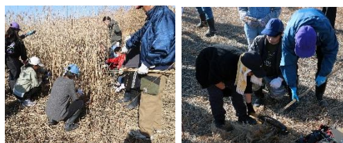
カマの使い方を教わり、慎重にヨシ刈りや 穂先の切り取り作業をする児童たち