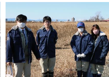
庄内川河川事務所のスタッフも 支援者としてお手伝い