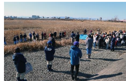
支援者のみなさんに挨拶する 児童のみなさん