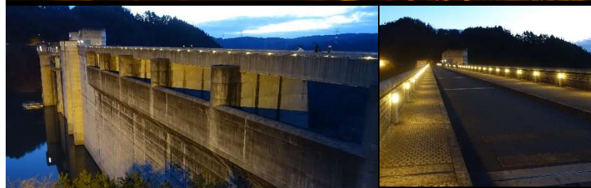
光の列に彩られて幻想的なダムの入口へと続くダムの天端

今年は小里川ダム完成20周年を記念して「キラキラライトアップカード」の配布も行われ、多くの方が幻想的な小里川ダムのライトアップを楽しみました。