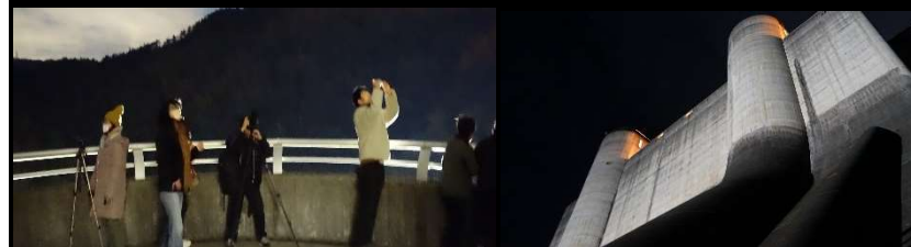
小里川ダム名物の展望テラスからのアングルも夜だと一味違います