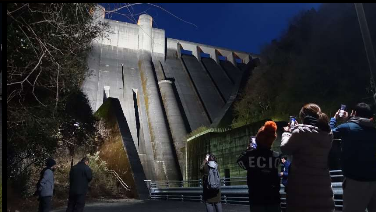
スマホをかまえてベストアングルを探す来場者の皆さん