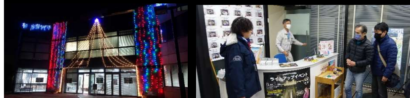
イルミネーションで彩られた管理所の1Fでは、キラキラライトアップカードの配布が行われました！