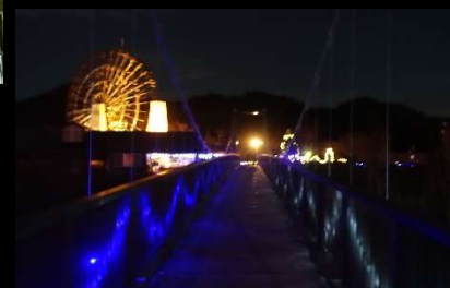
管理所から道の駅に続く橋とライトアップされた道の駅の水車