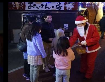
地域の方がサンタさんに扮し、お菓子の配布を実施