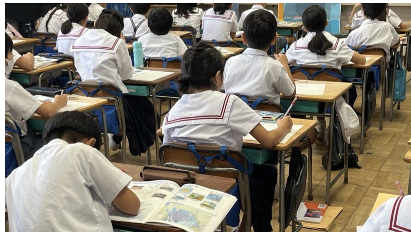
授業に真剣に取り組む児童たち