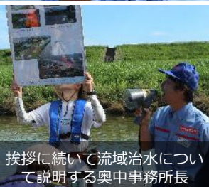
挨拶に続いて流域治水について説明する奥中事務所長