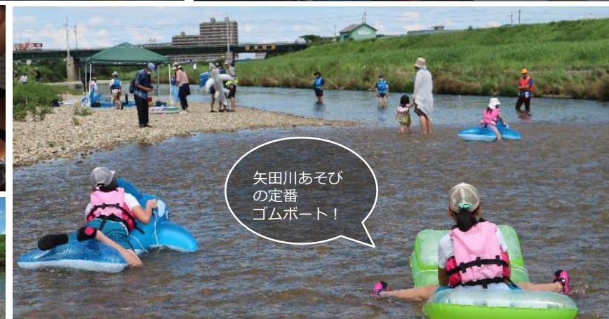
浅瀬だけど流れがあってゴムボートがスイスイ進んで楽しいね!