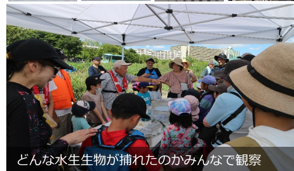
どんな水生生物が捕れたのかみんなで観察