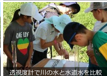
透視度計で川の水と水道水を比較