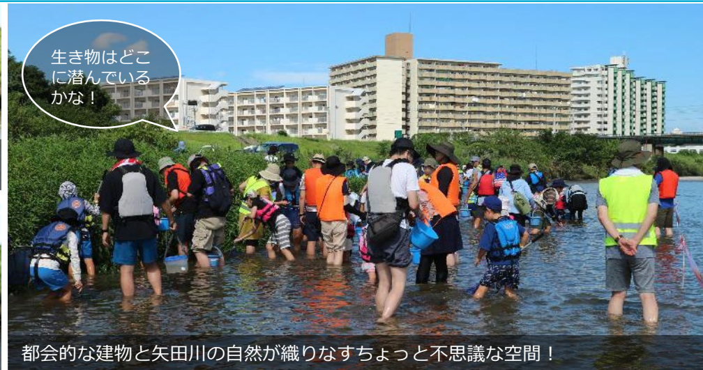
都会的な建物と矢田川の自然が織りなすちょっと不思議な空間!