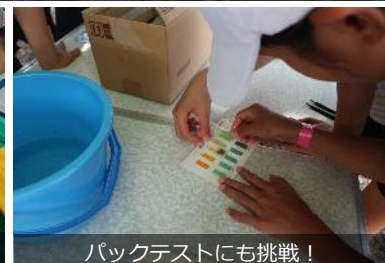
バックテストにも挑戦!