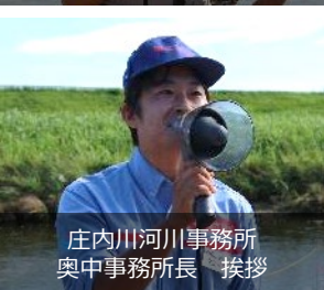
庄内川河川事務所 奥中事務所長 挨拶