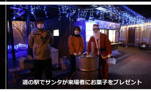
道の駅でサンタが来場者にお菓子をプレゼント