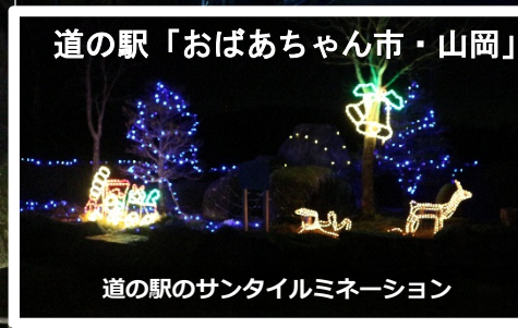
道の駅「おばあちゃん市・山岡」