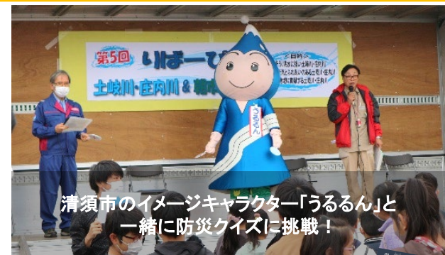
清須市のイメージキャラクター「うるるん」と一緒に防災クイズに挑戦！