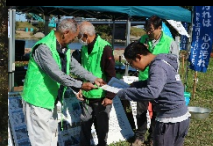
ウナギを釣って特別部門賞を受賞

シラハエ・鮎の部の優勝者には市長杯が、鯉の部の優勝者には庄内川河川事務所長賞がそれぞれ贈呈されました。 見事優勝された皆さまおめでとうございます！