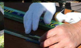
いざ計量 結果はいかに！