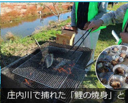
庄内川で捕れた「鯉の焼身」と「シジミ汁」の食味テストに挑む希望者の皆さん