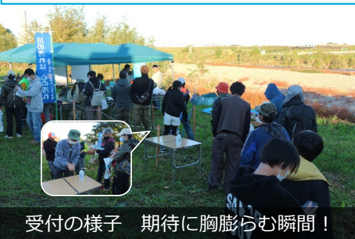
受付の様子 期待に胸膨らむ瞬間！

11月6日（日）に、庄内川（水分橋～新川中橋）で、庄内川まつり「第48回魚釣り大会」（主催：矢田・庄内川をきれいにする会）が開催されました。この大会は昭和51年から毎年開催され、庄内川が魚のおいしく食べられる川に戻ることが目的に、水質などの環境について考える機会を提供するものです。好天に恵まれ絶好の釣り日和となった会場には、釣り好きの大人から若者、子どもたちの参加者約80名が集まり、それぞれが自慢の腕を発揮する大会となりました。