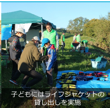
子どもにはライフジャケットの貸し出しを実施