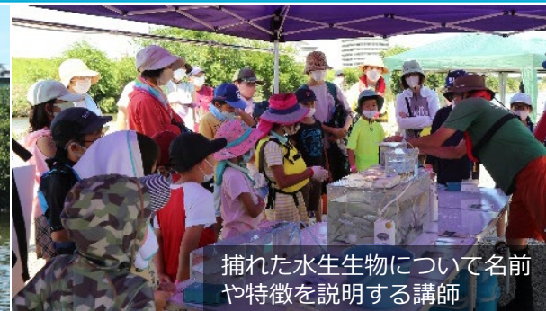
捕れた水生生物について名前 や特徴を説明する講師