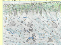
防災教育～近年の大規模水害の説明～