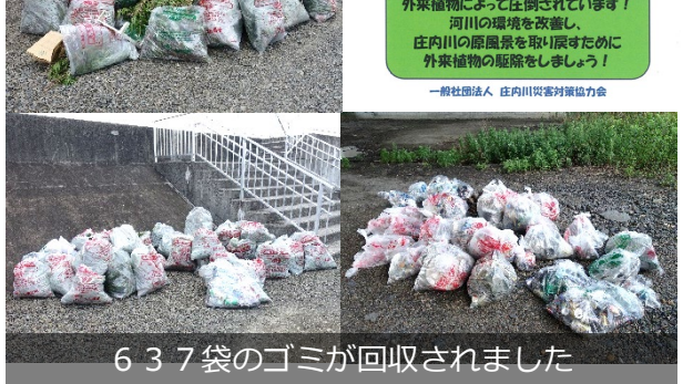
637袋のゴミが回収されました

※新型コロナウイルス感染症拡大防止のため、マスクの着用、消毒等の対策を行い、開催しました。