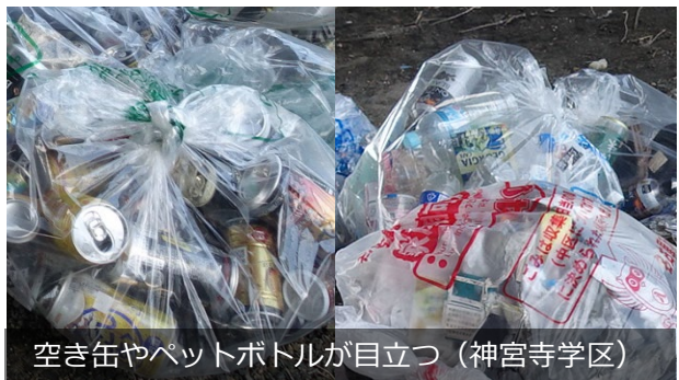
空き缶やペットボトルが目立つ（神宮寺学区）