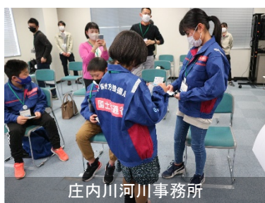
庄内川河川事務所