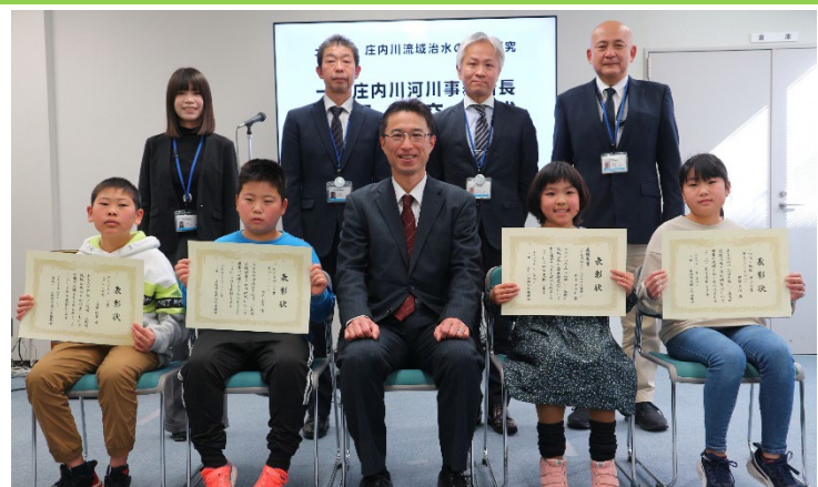
受賞者の皆さんと記念撮影