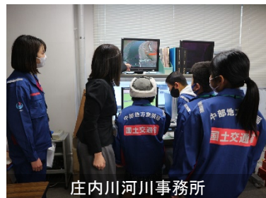
庄内川河川事務所