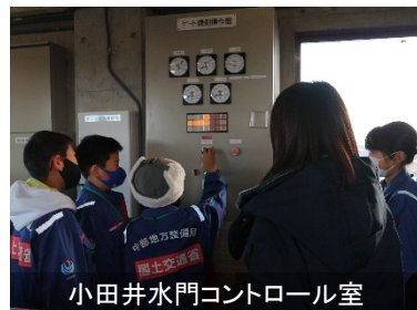
小田井水門コントロール室