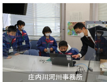
庄内川河川事務所