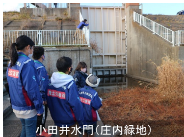
小田井水門(庄内緑地)