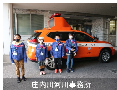
庄内川河川事務所