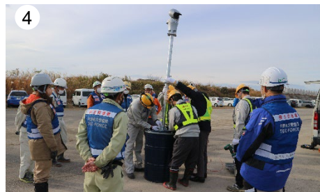
① ドラム缶を利用したコンパクトな漏水監視カメラについて説明 ②③ 漏水監視カメラの組み立て方を間近で学ぶ参加者のみなさん