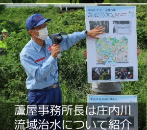
蘆屋事務所長は庄内川流域治水について紹介