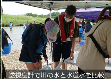
透視度計で川の水と水道水を比較