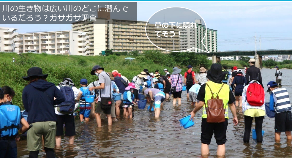
川の生き物は広い川のどこに潜んでいるだろう？ガサガサ調査