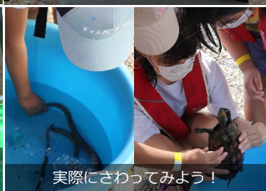
実際にさわってみよう！