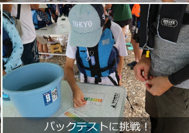
パケットテストに挑戦！