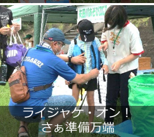
ライザジャグ・オン！さあ準備万端