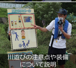
川遊びの注意点や装備について説明