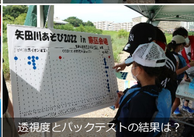
透視度とパケットテストの結果は？

矢田川あそびではおなじみのボートあそび、名古屋市内でこんなふうに川あそびができる矢田川ってすごい！