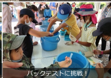
バケットテストに挑戦!