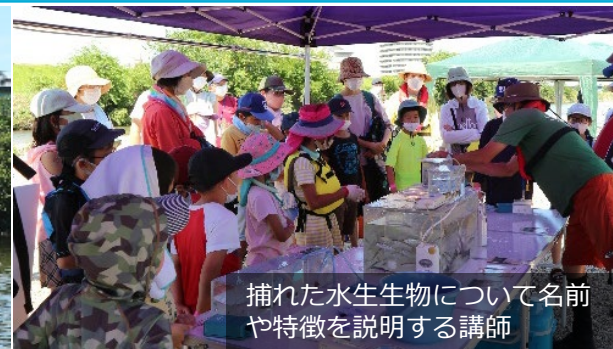
捕れた水生生物について名前 や特徴を説明する講師