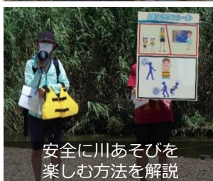
安全に川あそびを 楽しむ方法を解説