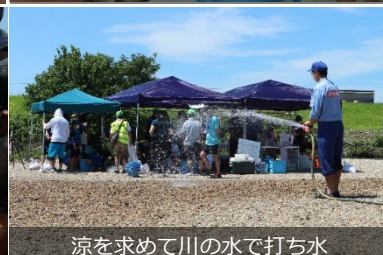
涼を求めて川の水で打ち水

みんなでボートあそび、名古屋市市内でもこんなふう川あそびができる場所があるんです!【ボート遊び】(矢田川子どもの水辺)