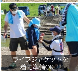
ライフジャケットを 着て準備OK!