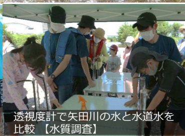
透視度計で矢田川の水と水道水を 比較【水質調査】