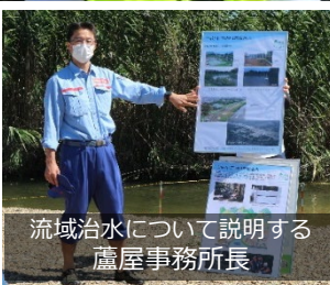
流域治水について説明する 蘆屋事務所長