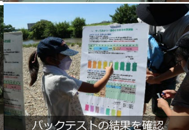
バケットテストの結果を確認