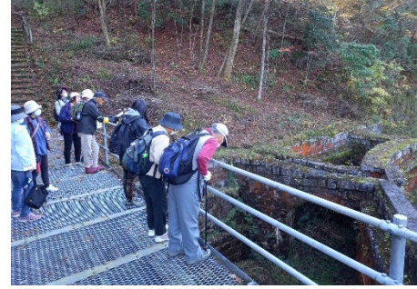
旧発電所 貯水槽跡地

参加者：115名 [ 地元：73名（瑞浪・恵那） 県内：32名 県外：10名 ]