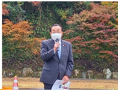
開会式挨拶（瑞浪市長）