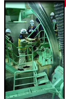
常用洪水吐ゲート見学