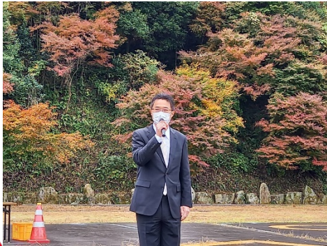
開会式挨拶（事務所長）

好天に恵まれた中、県内外から115名が参加されました。案内人の同行のもと、地域の自然・文化・伝統とふれあいながら、紅葉に彩られたダムの湖畔約7.5kmのコースを歩きました。