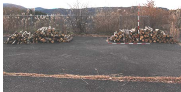
配布予定の伐採木の状況