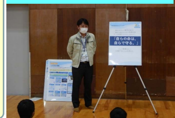
防災学習 ～「自らの命は自らで守る」～

※新型コロナウイルス感染症拡大防止のため、マスクの着用、消毒、検温等の対策を行い、開催しました。