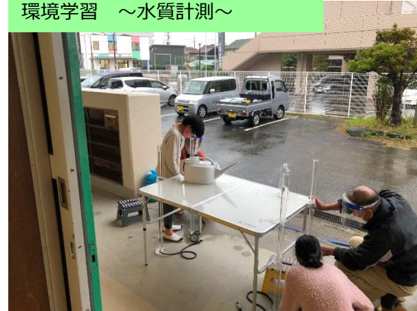
環境学習 ～水質計測～