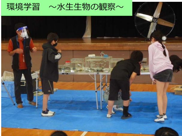
環境学習 ～水生生物の観察～