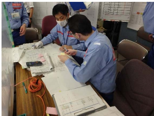
災害申請資料作成