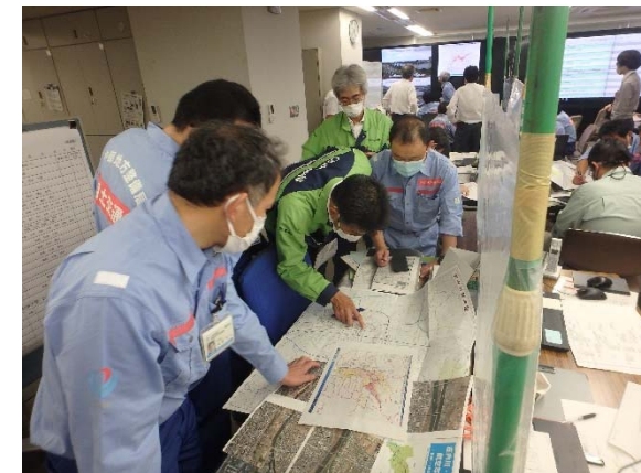
災害対策協力会からの助言

※新型コロナウイルスの感染拡大防止のため、マスク着用や間仕切りを設置する等、必要な対策を講じて実施しました。