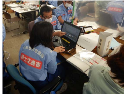
排水活動支援ツールを用いた ポンプ車等の配置検討