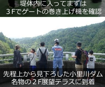
先程上から見下ろした小里川ダム名物の2F展望テラスに到着