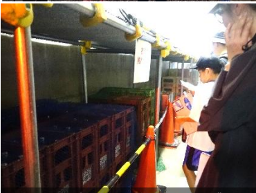
2Fの監査廊で保管しているダム酒はダム酒フェスタにも出品予定