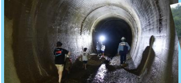
現在は使われていない転流トンネルを点検。奥にはコウモリが！