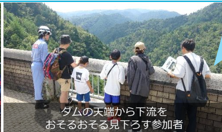
ダムの天端から下流をおそるおそる見下ろす参加者