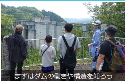
まずはダムの動きや構造を知ろう