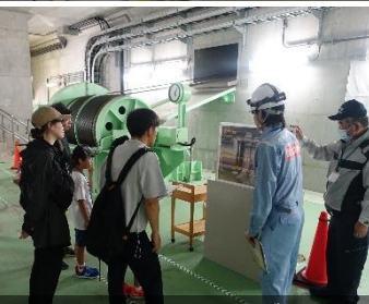
堤体内に入つてまずは3Fでゲートの巻き上げ機を確認