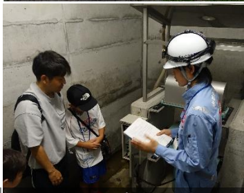
1Fに移動してブラムライン室で堤体のたわみを確認