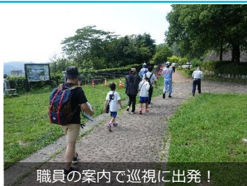
職員の案内で巡視に出発！