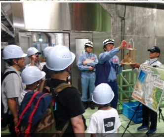
2Fゲート室に入る前に模型で仕組みを解説