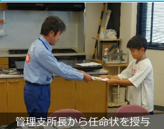
管理支所長から任命状を授与

小里川ダムは、8月5日(火)・6日(水)・14日(木)に、夏休み期間中における自由研究等の題材としていただくことを目的に、参加者を「一日ダム管理職員」として任命し、ダムの施設点検や、実際に船に乗って行う湖面巡視、水質検査測定など、普段は体験できないことに触れ、ダムについて楽しく学んでいただく「一日ダム管理職員体験」イベントを実施しました。