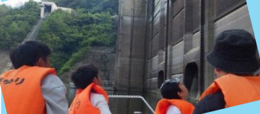
約2時間半の体験もあと少し 湖面からボートで法面などを点検