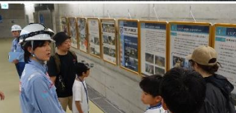
1F通路では災害時に活躍するテックフォースをパネルで紹介