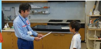
おつかれさまでした！最後に修了証を授与

1Fの広場から見上げる小里川ダムの堤体は迫力満点！半円形導流壁が特徴的な小里川ダム