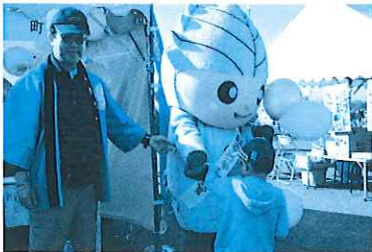
大治町のはるちゃん(昨年) 魚のつかみ取り(イメージ)

国土交通省 庄内川河川事務所 HP http://www.cbr.mlit.go.jp/shonai/