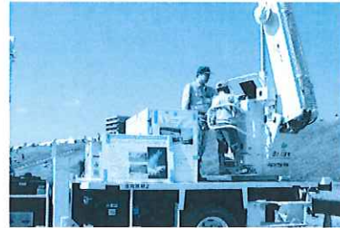
災害対策車の展示(昨年) 高く飛べ、紙飛行機(昨年)