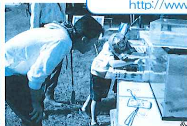
お魚観察(ガサガサ探検)(昨年)