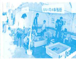
お魚ふれあいウォッチング