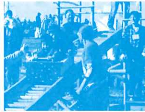
バンブーコースター