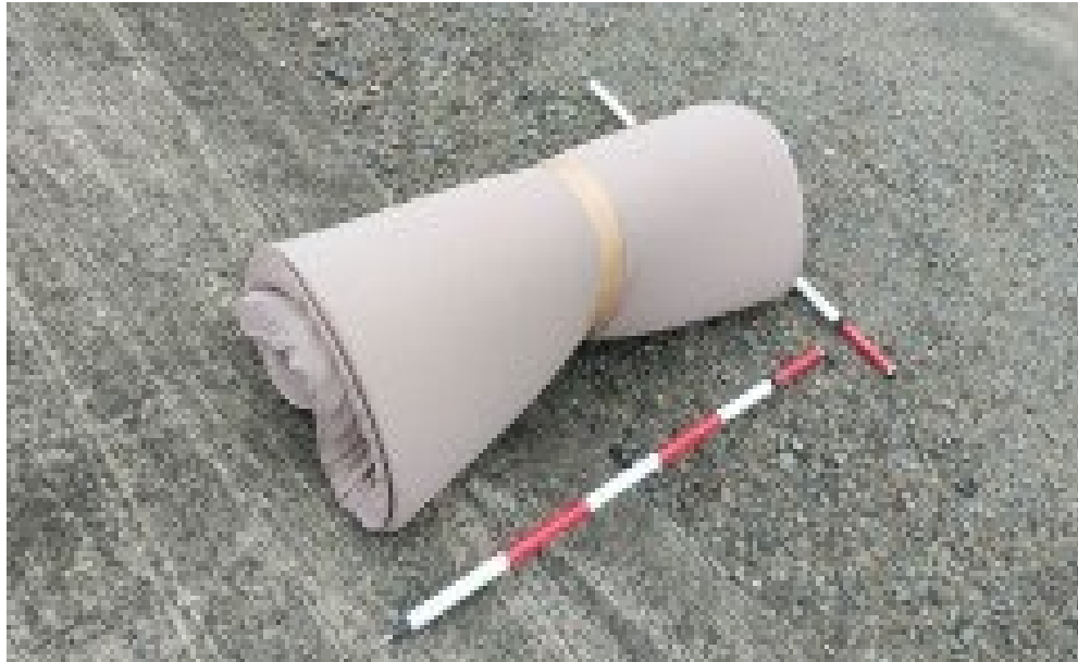
マット × 1