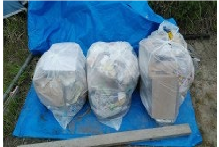
ごみ袋 900 × 3