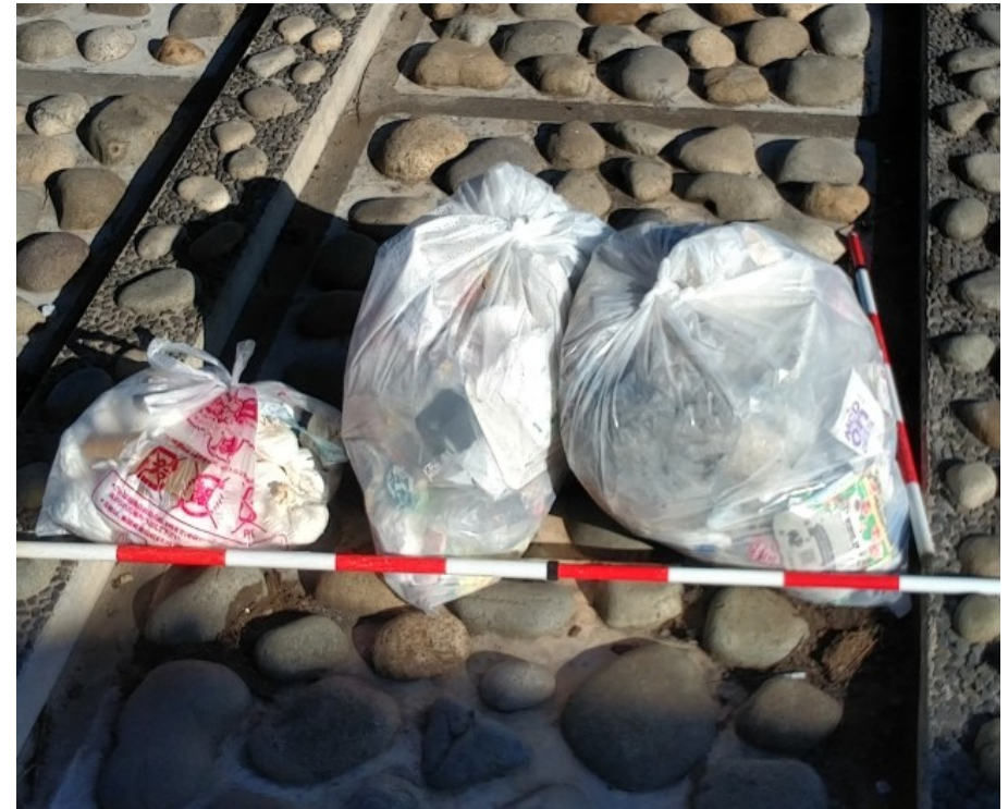
② 正徳橋橋梁下小段 ゴミ 3 袋