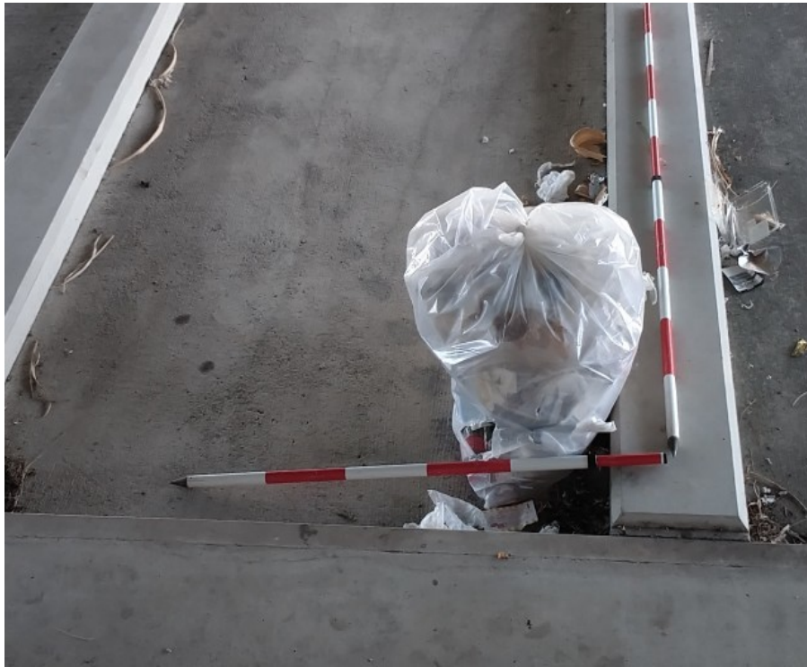
① 一色大橋橋梁下小段 ゴミ 1 袋