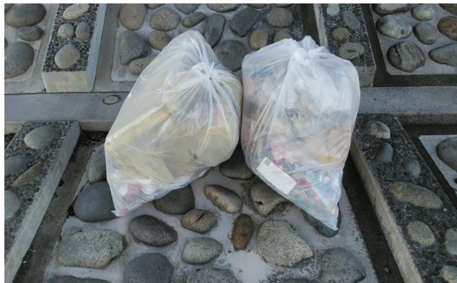
② 正徳橋下 90ℓのゴミ 2袋