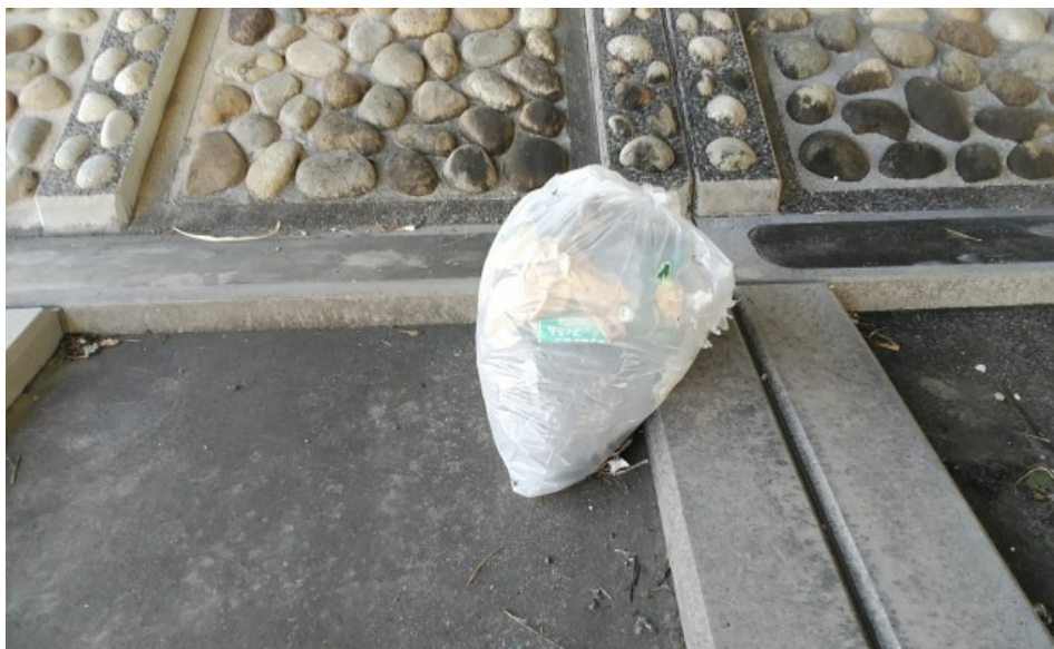
① 一色大橋下 90ℓのゴミ 1袋