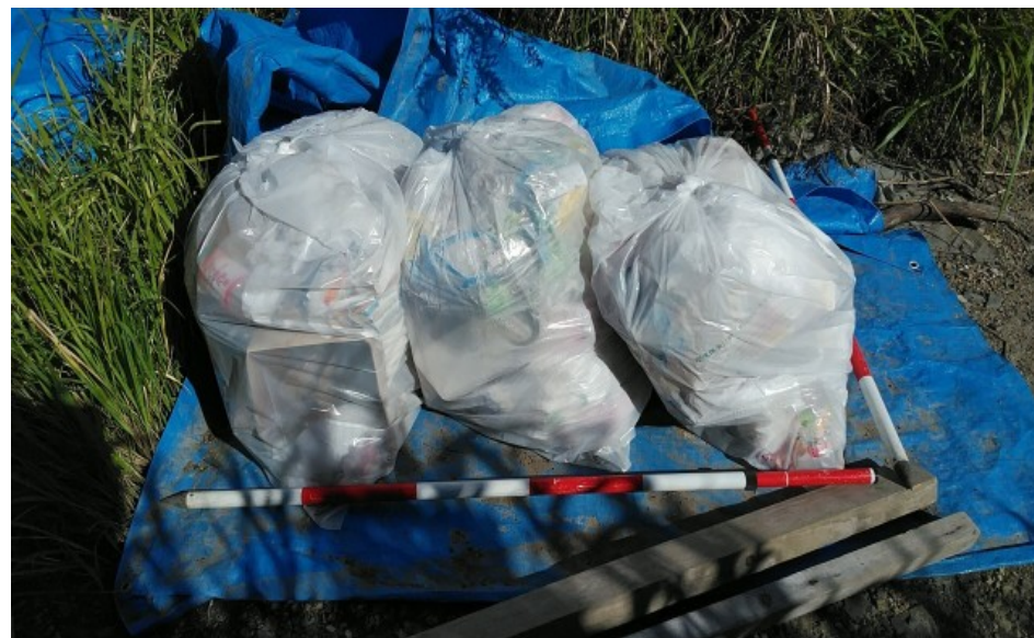
② 90ℓのゴミ 3袋