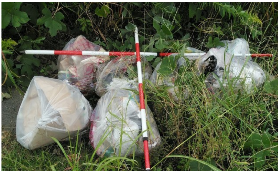
① 45ℓのゴミ 7袋 (重なっていたため、正確には10袋あり)