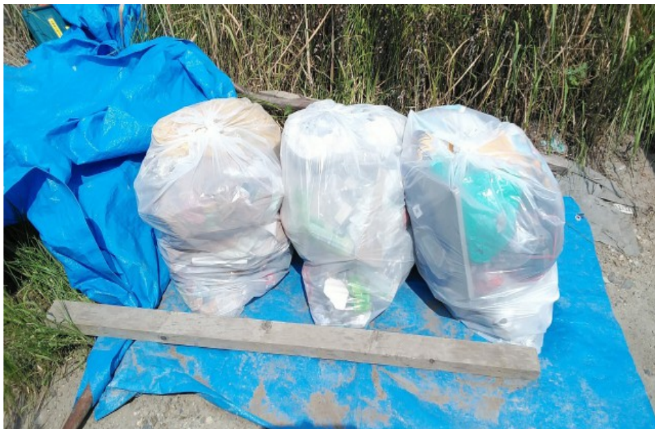
90ℓのゴミ 3 袋