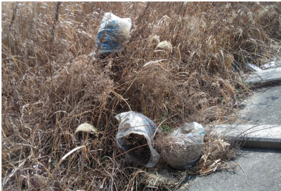
③ 一色大橋梁下 ゴミ