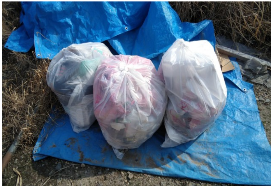
② 明徳橋下流 ゴミ