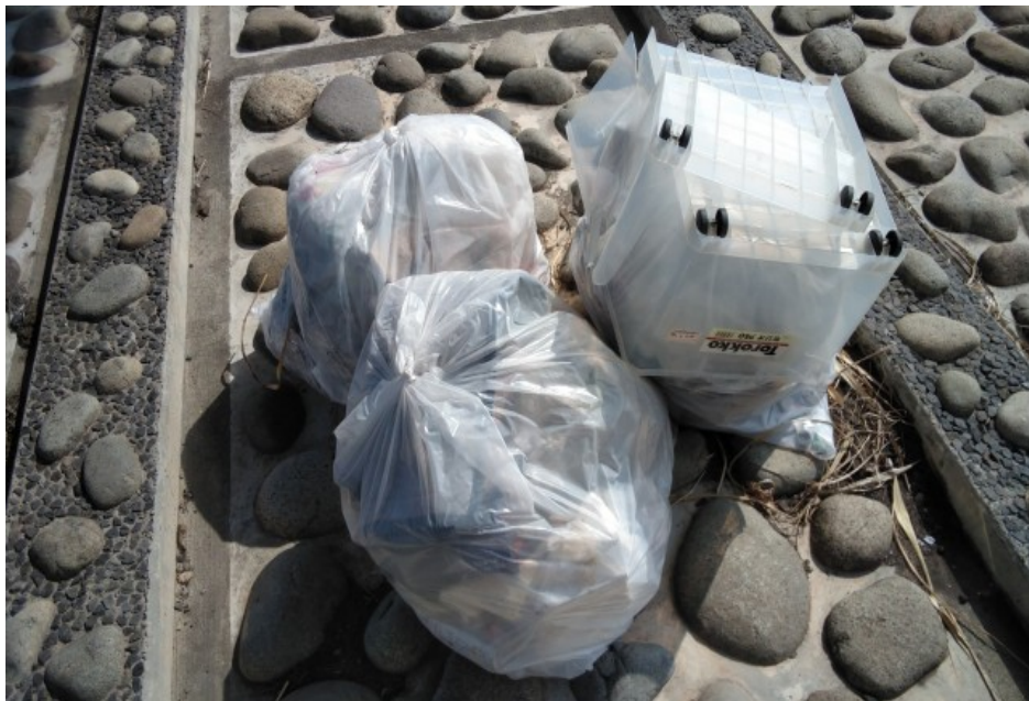
① 正徳橋橋梁下 ゴミ