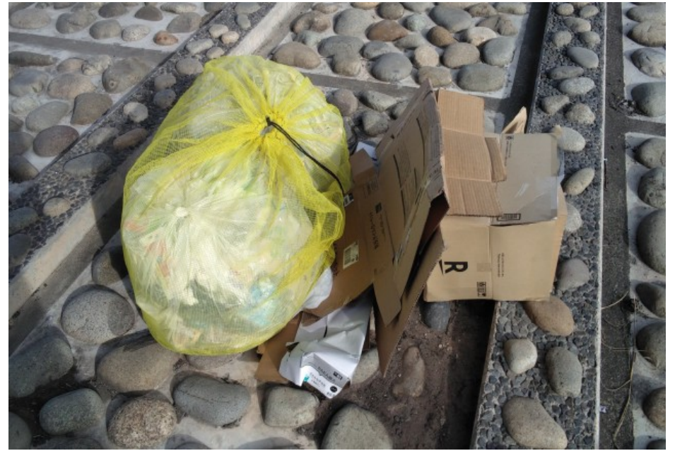
② 橋梁下 ゴミ