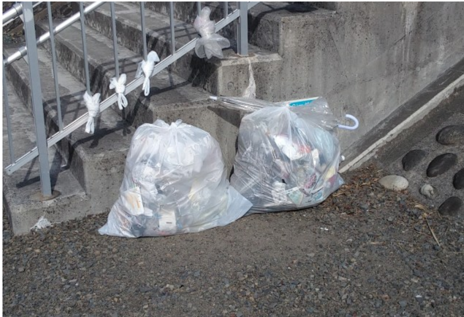
① 階段下 ゴミ