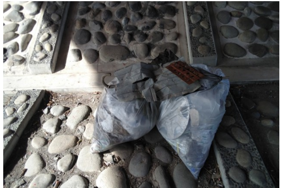
② 明徳橋橋梁下 ゴミ