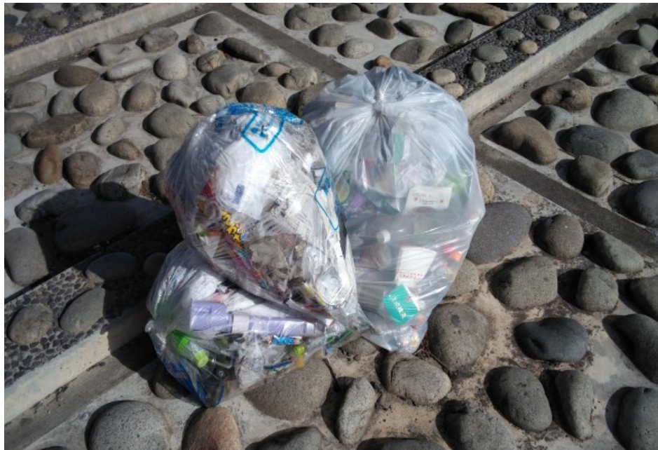
① 正徳橋橋梁下 ゴミ