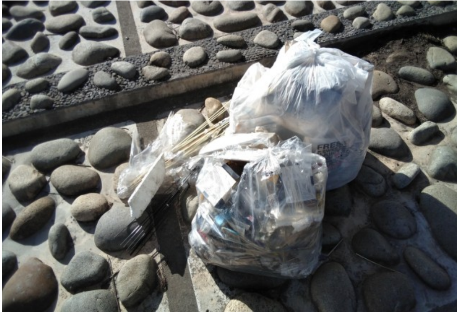
① 90 リットル 2 袋、傘