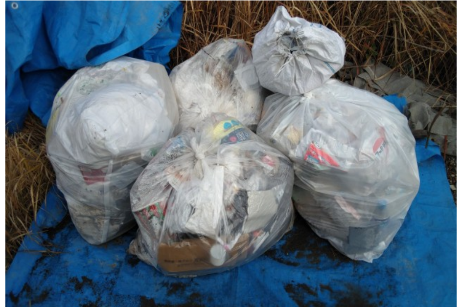
② 90 リットル 4 袋、土嚢袋 1 袋