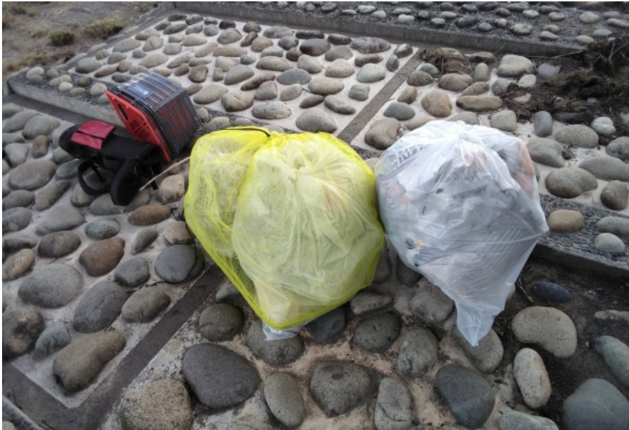
90 リットル 3 袋、ゴルフバッグ、買い物カゴ