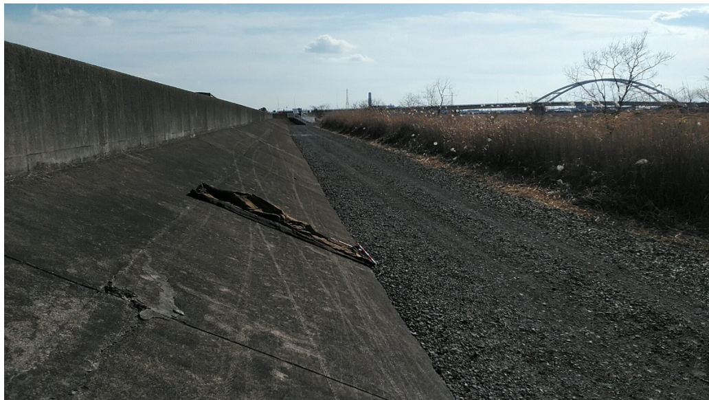
南陽大橋上流、麻生地投棄物